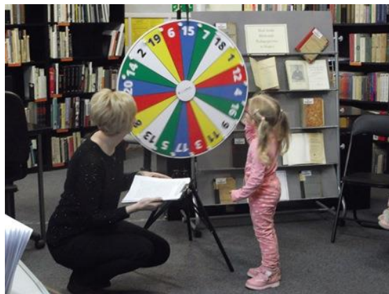
Zabawa kolorami i koło fortuny