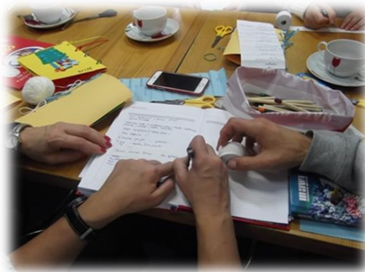
Nauczyciele tworzą książkę

Spotkaniu towarzyszyła wystawa nowości książkowych, które wzbudziły zainteresowanie wśród nauczycieli. Były to różnorodne pozycje książkowe, z których inspirację mogą czerpać nie tylko dzieci, ale także rodzice, nauczyciele i terapeuci. Mogą być wykorzystywane w domu, w przedszkolu, w szkole, świetlicy, a także na zajęciach terapeutycznych w placówkach szkolnictwa specjalnego. Ich wizualizacja, ciekawa szata graficzna zachęca do wspólnych zabaw wokół tekstu, można znaleźć w nich twórczą rozrywkę. Krótko mówiąc, zaprezentowane książki są nietuzinkowe i nieszablonowe – stąd duże nimi zainteresowanie.