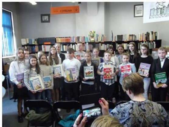
Omówienie konkursu i nagrodzeni laureaci