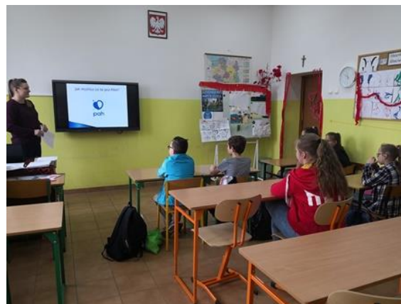
Prezentacja materiałów PAH