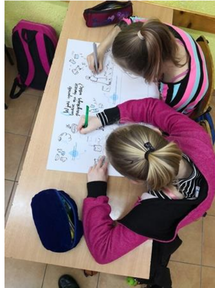
Praca z planszami