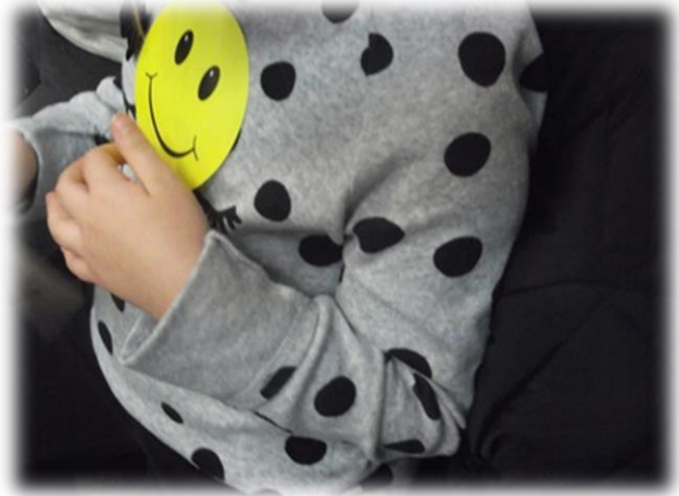
Prezentacja książek 3D i podsumowanie zajęć